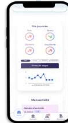
Suivi à distance