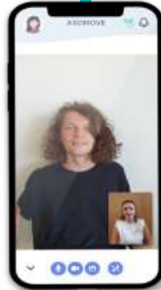
Prise en charge à distance